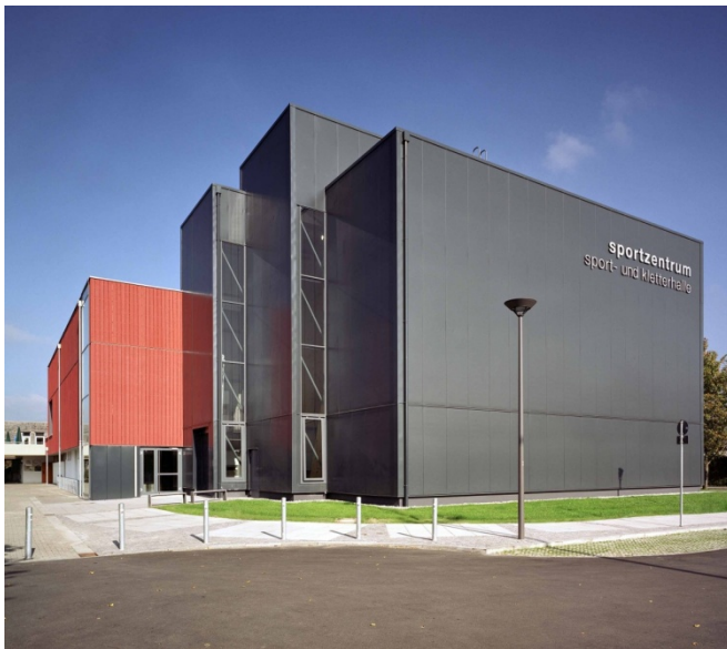
In der Kletterhalle haben Sportler je nach Leistungs- und Altersstufe die Wahl zwischen einer Kinderkletterwand, einem Boulderbereich oder einem großzügigen Schulungs- und Wettkampfbereich.