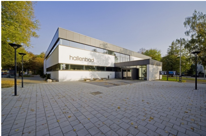
Hallenbad Ravensburg – für Sportler und Familien