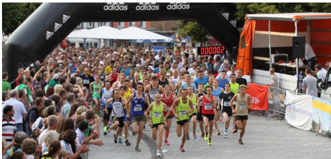
Am Ravensburger Stadtlauf durch die historische Altstadt unter dem Motto "Ravensburg läuft – komm lauf mit" nehmen Bambini und Schüler, Jugendliche und Erwachsene, Hobby- und Spitzenläufer teil.