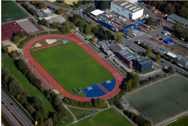
Das Sportzentrum Ravensburg im Rechenwiesen bietet Leistungs- und Hobbysportlern ein breites Angebot.