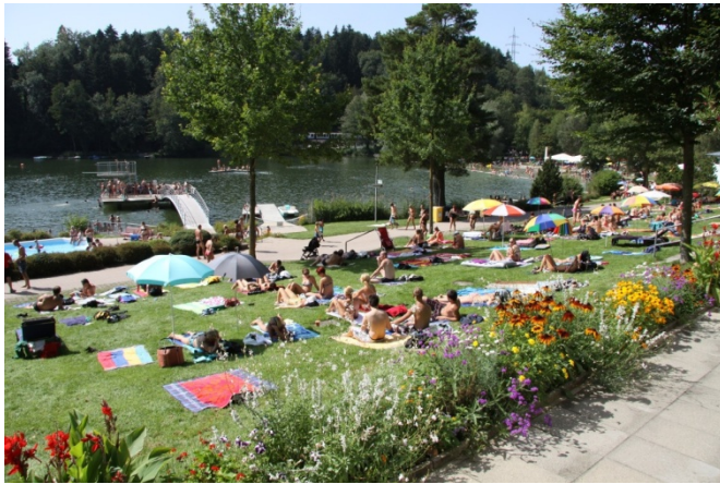
Flappachbad Ravensburg - das idyllische Naturfreibad

Die Fotos können Sie in hochauflöster Form in der Bilderliste herunterladen.