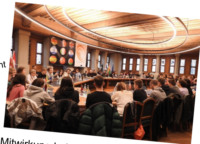
Mitwirkung bei der Intern. Jugendkonferenz