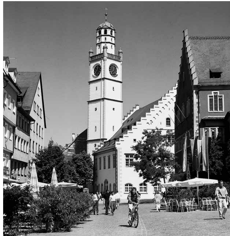
Blaserturm und Waaghaus