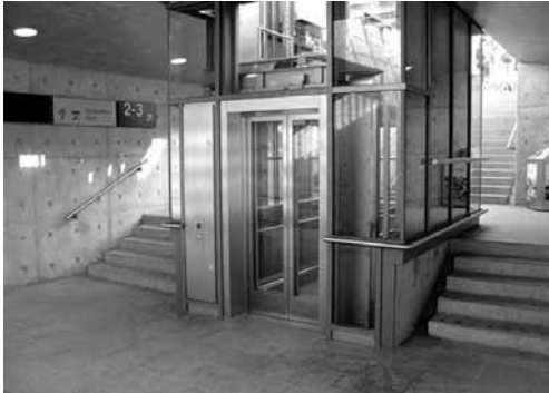
Die Gleise am Bahnhof Ravensburg sind mit dem Aufzug zu erreichen