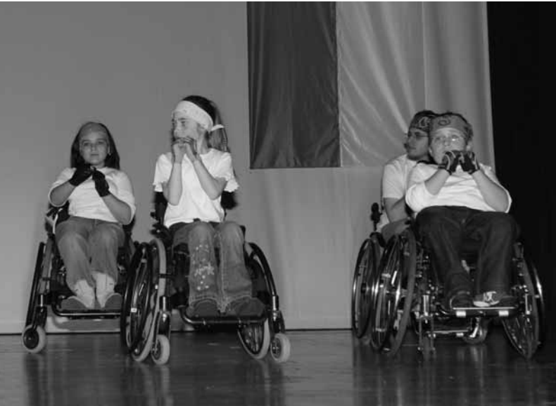
Rollstuhlsport für Kinder und Jugendliche