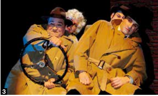
3 Das letzte Mal in dieser Saison und ein beliebter Klassiker am Theater Ravensburg: Die 39 Stufen.