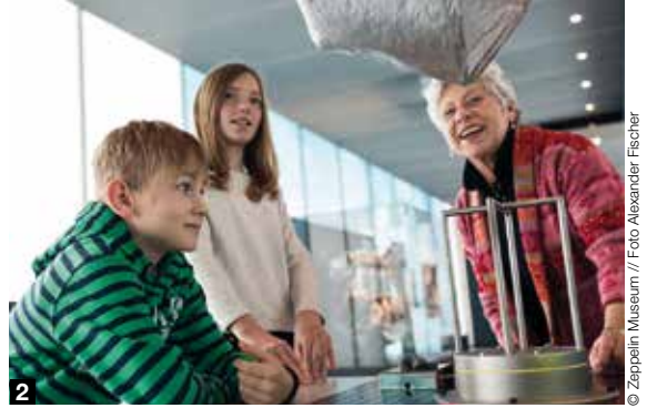
1 Lust, mal wieder so richtig zu staunen? Bei den Führungen wird Schulgeschichte lebendig.