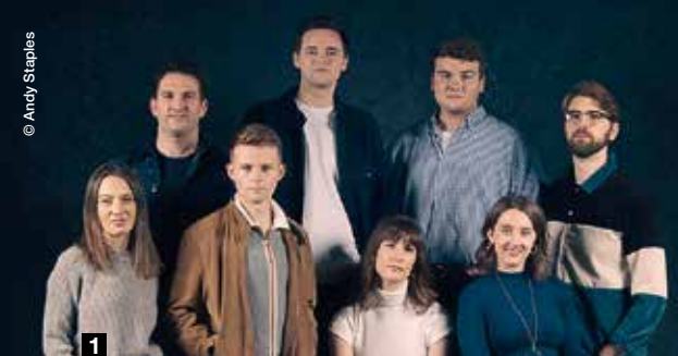
1 Stimmgewalt plus Orgel: VOCES8 treffen auf den Organisten Nikolai Geršak.