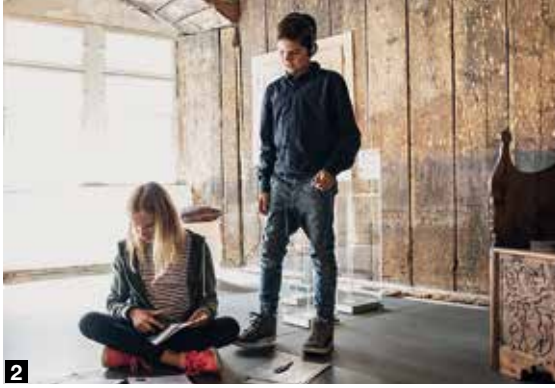
2 Abenteuer in jeder Ecke: Bei der Museumsrallye im Museum Humpis-Quartier wird Geschichte spielerisch erlebbar.