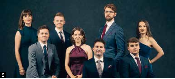
Das britische Vokalensemble VOCES8 ist schlichtweg ein Weltklassevokalensemble.

an und eine Schulklasse verkauft Waffeln und Kuchen. Schulmuseum Friedrichshafen, 11–17 Uhr. Eintritt frei.