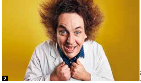
2 Der Entertainer zeigt, dass Wissenschaft richtig Spaß machen kann.