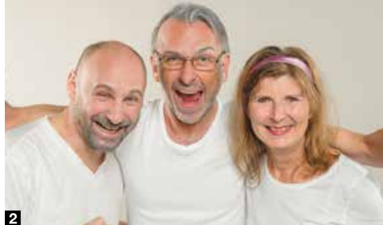
2 „Wir sind die Neuen“ ist eine hinreißende Generationskomödie.