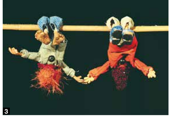
3 Nils Karlsson ist ein liebevolles Stück über die Großartigkeit von Freundschaft.

Alle Angebote mit Anmeldung unter Tel. 0751/82 2685.