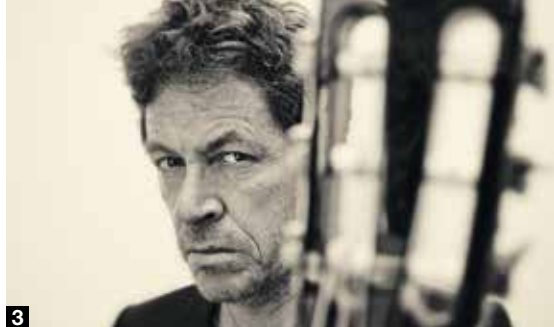
3 Dominic Miller ist ein impressionistischer Klangmaler mit einer grandios subtilen Band.