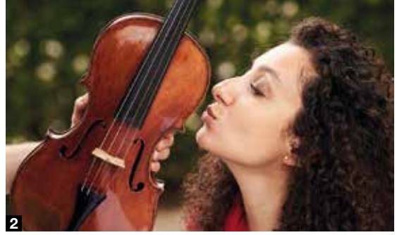
2 1000 Jahre armenische Musik: mit der Artist in Residence Chouchane Siranossian.